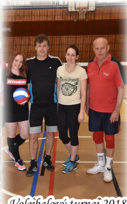
Volejbalový turnaj 2018