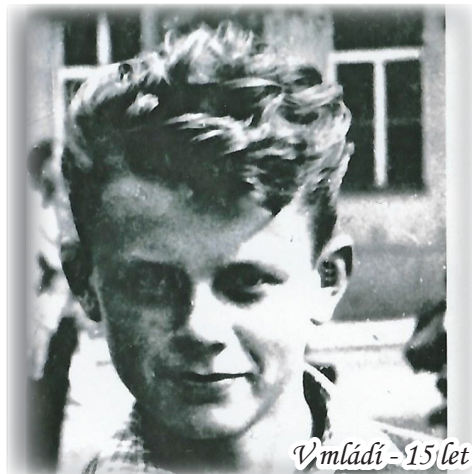
V mládí - 15 let

Byly to tragédie. Bratr byl starší než já a pracoval Šumperku. Na nádraží si lidé krátili cestu do depa přes koleje. Jednou jsem