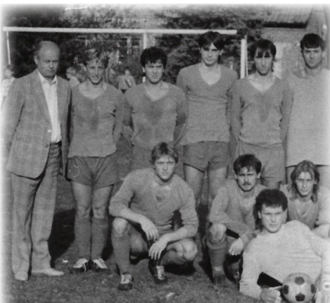
Fotbalový trenér - 1990/91

S fotbalem to bylo obdobné. Byla tady dobrá parta. Jednu dobu ale přišla krize a vypadalo to, že se u nás fotbal zruší. Naštěstí jsme to zvládli. Čekali jsme na nové hřiště, které se mělo postavit do roku 1972. Mám doma dodnes projektovou dokumentaci toho areálu. Měl tam být skokanský bazén, tenisové a volejbalové kurty, atletický ovál a samozřejmě fotbalové hřiště. Bohužel vše skončilo na penězích. Když jsem přestal aktivně hrát, začal jsem trénovat, což mě velmi bavilo. Fotbalu jsem věnoval opravdu hodně času.